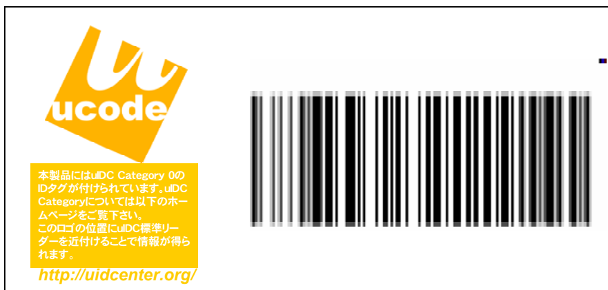
図 1 表示例